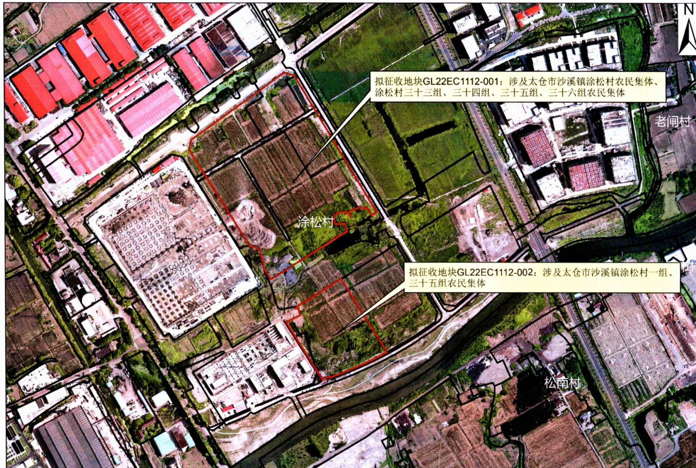
拟征收土地位置示意图